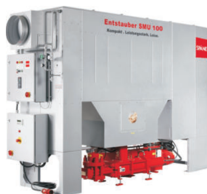
SMU 60 - 100 mit Brikettierpresse