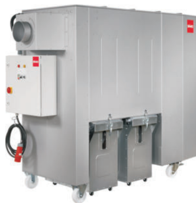
SMU 32 - 45