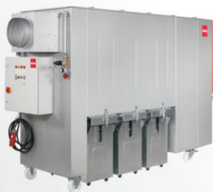
SMU 60 - 100 mit Abfülltonnen