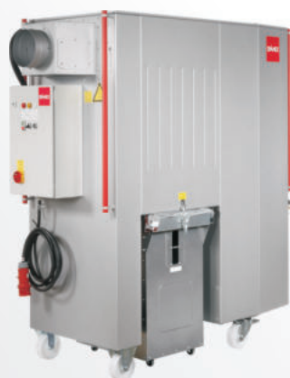
SMU 12 - 30