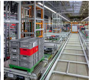
Vertikalförderer mit Shuttle Anbindung