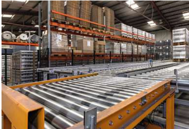
Rollenbahnen und Verschiebewagen im Verbund

Seit mehr als sechs Jahrzehnten ist HaRo auf dem Gebiet der Fördertechnik erfolgreich tätig. Namhafte europäische Industrieunternehmen bauen auf das Knowhow und den Service der HaRo-Gruppe.