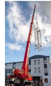
Montage eines Vertikalförderers