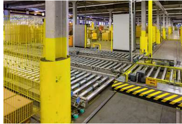
Fördertechnik mit niedriger Bauhöhe